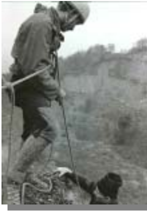
Körpersicherung im klassischen Stil der 60er

Ohne Trittleitern war die vertikale Fortbewegung wohl kaum denkbar gewesen! Lothar Brückner in Bohrhakenleiter 8- (Bild rechts)