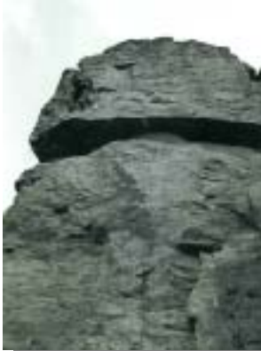
Das Topropedach war schon in den 60er Jahren begehrt!!

Mehr Informationen über den Schriesheimer Steinbruch erhalten ihr auch unter www.ag-klettern-odenwald.de oder in der 2007 veröffentlichten Faltbroschüre „